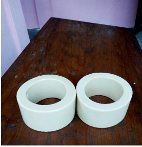
Thsotorü 'Man's attire'

thsotorü [ʃotoru] Noun . ivory armlets; गजदंत.