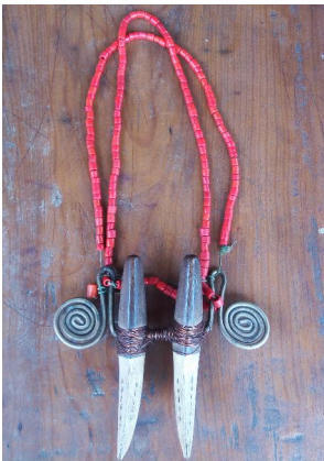
Khüzü hü lak 'Male necklace'

khüzü hü lak [k h uzu hu lak] Noun. Male necklace; नर हार.