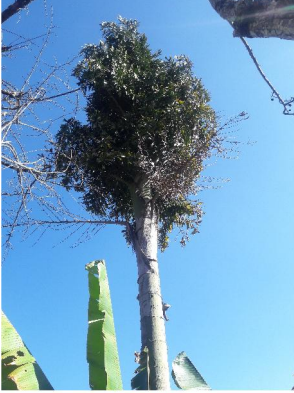
Ashitong 'Tall tree'