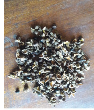
Müngümji 'Flavouring spice'