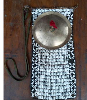
Rehütam 'Dress ornament'

rehütam [rehutam] Noun . ceremonial apron; औपचारिक एप्रन.