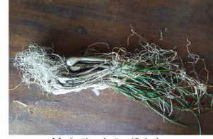
Morimüjam lasüŋ 'Spice'

morimüjam lasüŋ [morimuzam lasuŋ] Noun. Local onion, spice.