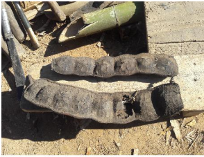
Khuyi 'Wild beans used for making shampoo'

khuyi [k h uji] Noun. wild beans used for making shampoo.