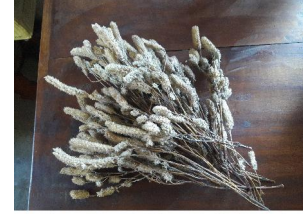
Chungyün 'Flavouring herb'

chungyun [tsunjun] Noun. flavouring herb.