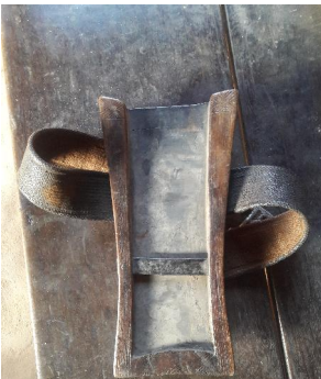
Noktrüp 'Dao case'