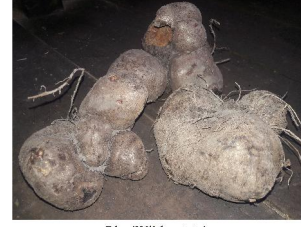
Rhu 'Wild potato'

rhük [ʃuk] Verb. bind/tie; गुलोबन्द . Arüpo apinü rhük He bind them. वह उन्हें बांधता है.