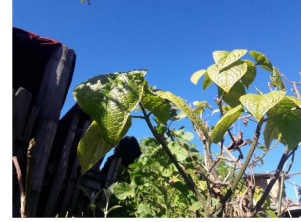
Kumörung 'Medicinal herb'