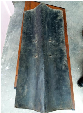
Shih küp tsung 'War shield'