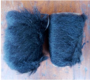
Jing tüm 'Leggings made of bear skin'

jing tüm [ziŋ tüm] Noun. leggings made of bear skin.