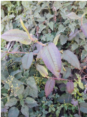
Lilipong 'Medicinal herb'