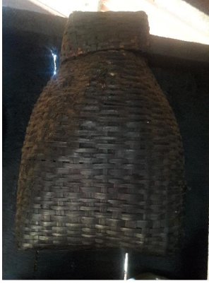
Thru 'Bamboo basket'

thrukiang [tʰrukiang] Noun. throat; गला.