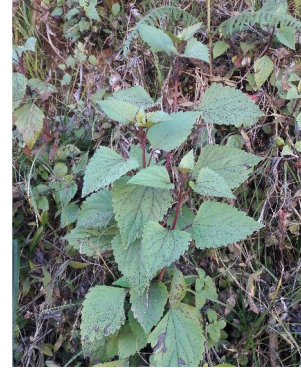
Tajunglampa 'Medicinal herb'