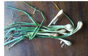
Songpüng lasüŋ 'Spice'

shotün [ʃotun] Noun. price; कीमत. shoyam [ʃojam] Noun. bank; बैंक. shozüŋ zokhi/lukhi [ʃozuŋ zokʰi/lukʰi] Noun. mortgage; बंधक. shu [ʃu] Adverb. far; दूर. shuhkih [ʃuʔkiʔ] Verb. lift; दिल बढ़ाना. shuhmukhungkhi [ʃuʔmukʰuŋkʰi] Noun. coherence; जुटना. shuhmülang ajihpü [ʃuʔmuɫaŋ aziʔpu] Noun. sacrifice; ईसाई का जल संस्कार. shuhmülangajihkhi [ʃuʔmuɫaŋaziʔkʰi] Noun. devotion; अनुराग. shuhmuwuh [ʃuʔmuwuʔ] Verb. apart; अलग. shuhrhüm [ʃuʔʃum] Noun. stench; गंदगी. shuhyi [ʃuʔji] Noun. monkey; बंदर. Shuhyi khunung Group of monkeys. बंदरों का समूह। shuhyini [ʃuʔjini] Noun. twilight; साँझ. shuhyitükhaso-kipe [ʃuʔjitukʰaso-kipe] Noun. almond; बादाम. shukhiam mülong rozhak shukheamkhi [ʃukʰiam] Noun. comfort; आराम. shulünkhim [ʃulunkʰim] Noun. robe; लबादा. shumuliu [ʃumuliu] Noun. fog; कोहरा. shung [ʃuŋ] Noun. top; ऊपर. shungpung [ʃuŋpuŋ] Noun. mortar; गारा. shungsang [ʃuŋsaŋ] Noun. pestle; मूसल. shutangarih [ʃutaŋariʔ] Noun. assembly; सभा. so [so] Verb. hear; सुनो. Nimong apan Sita hi chu khi inü so choh Everyday I heard Sita pounding grain. हर रोज मैंने सीता को अनाज कूटते हुए सुना। somünak [somunak] Noun. housefly; मक्खी. songpüng lasüŋ [soŋpuŋ lasuŋ] Noun. Local garlick, spice.