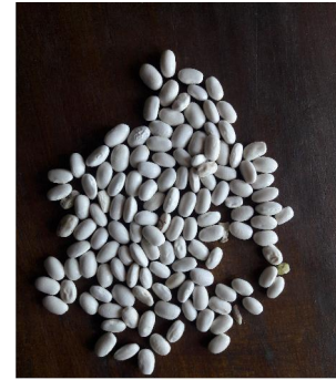
Aphinpe kolarü 'White bean'

aniwu [aniwu] Adjective . solar; सौर. aniwüzah [aniwuza?] Noun . sunset; सूर्य का अस्त होना. aniwüzhlim [aniwuza?lim] Noun . west; पश्चिम. aniyin [anijin] Noun . sunlight; सूरज झूठ. ano, hüzhih [ano, huɟzi?] Noun . gum; गम. anüke [anuke] Noun . pus; मवाद. anükhüh [anuk hi u?] Determiner . few; कुछ. anungkho [anun hi kho] Noun . cheetah; चीता. anüpkhi [anupk hi ] Verb . sprain; मोच. anüpnüp yikhap [anupnup jik hi ap] Noun . loaf; पाव रोटी. anüpfung akhuh [anupun] Noun . bud; कली. anyi [api] Noun . mother's brother's wife; माँ के भाई की पत्नी. apa [apa] Noun . mother; माँ. apahpe [apa?pe] Noun . subtraction; घटाव. apan [apan] Determiner . every; प्रत्येक. apanpü [apanpu] Noun . complete; पूर्ण. apepü [apepu] Verb . lead; नेतृत्व. apham [ap hi am] Noun . leprosy; कुष्ठ रोग. aphi [ap hi i] Noun . shaft; शाफ्ट. aphiakyukhu [ap hi iakjuk hi u] Noun . beer; बीयर. aphinpe [ap hi inpe] Noun . plane; विमान. aphinpe kholarü [ap hi inpe k hi olaru] Noun . kholar beans seed.